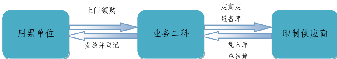
现货供应方式流程示意图:

② 现货供应:通用票据由业务二科定期定量向承印供应商下达印制通知书,注明相关要素,承印供应商按要求完成相应财政票据印制任务,并送达业务二科仓库存放。入库票据种类、数量记录到信息系统。用票单位可直接到业务二科业务窗口办理申领手续。业务二科审核批准后在信息系统中登记领购和发售信息,并根据每次入库票据数量开具财政票据入库单。印制通知书和入库单作为承印供应商向本单位结算印制服务费的依据。