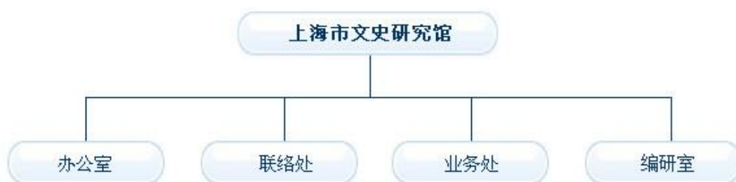
图 2：上海文史馆机构组织图