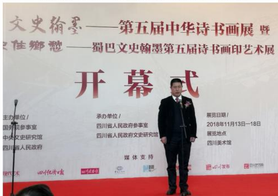
王卫民副主任致辞并宣布展览开幕

为纪念改革开放四十周年，深入学习贯彻党的十九大精神和习近平新时代中国特色社会主义思想，传承和弘扬中华优秀传统文化，11月13日至18日，由国务院参事室、中央文史研究馆、四川省人民政府主办，四川省人民政府参事室、四川省人民政府文史研究馆承办的“文史翰墨——第五届中华诗书画展”暨“记住乡愁——蜀巴文史翰墨第五届诗书画印艺术展”在四川美术馆举办。展览11月13日上午开幕，四川省人民政府参事室（文史研究馆）党组书记、参事室主任蔡竞主持开幕式。国务院参事室党组成员、副主任王卫民致辞并宣布展览开幕。中央文史研究馆文史司司长耿识博、四川省人民政府文史研究馆馆长何天谷等启动作品集首发仪式。来自全国各地文史研究馆的代表250余人出席了开幕式。上海市文史研究馆党组成员、巡视员王群，上海市文史研究馆原馆长、馆员吴孟庆，馆员曹旭和馆业务处副处长陈挺出席了相关活动。