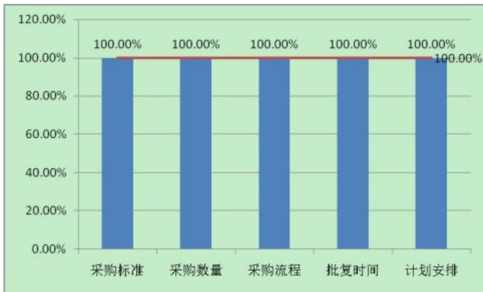
图 1 管理人员满意度

项目管理人员的综合满意度为 100%，其中对场地安排、内容丰富度、实施流程、开展秩序和社会影响力的满意度均为 100%。